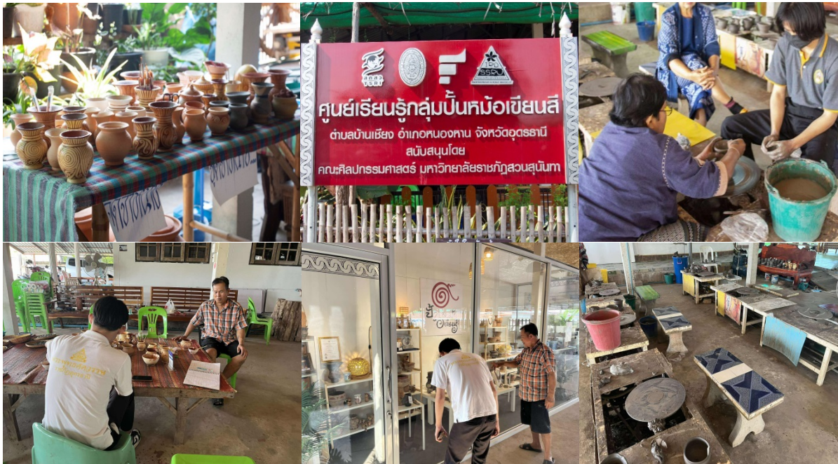
ภาพที่ 2 บริบททางกายภาพและการจัดกิจกรรมของวิสาหกิจชุมชนปั้นหม้อเขียนสี บ้านพิพิธภักดิ์

ข้อมูลจากการสัมภาษณ์เชิงลึกและการสนทนากลุ่มร่วมกับการใช้เทคนิค SWOT Analysis พบว่า ศักยภาพการพัฒนาสำคัญของกลุ่มวิสาหกิจชุมชนปั้นหม้อเขียนสี บ้านพิพิธภักดิ์ โดยแบ่งออกเป็นปัจจัยด้านต่าง ๆ ดังนี้