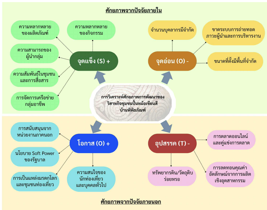
ภาพที่ 3 สรุปการวิเคราะห์ศักยภาพการพัฒนาของวิสาหกิจชุมชนบ้านหม้อเขียนสี บ้านพิพิธภักดิ์ โดยใช้เทคนิค SWOT Analysis

อย่างไรก็ตาม กลุ่มวิสาหกิจชุมชนบ้านหม้อเขียนสีแม้จะประสบความสำเร็จในด้านการพัฒนาผลิตภัณฑ์สะท้อนได้จากการได้รับรางวัลเชิดชูเกียรติต่าง ๆ เช่น รางวัล 10 สุดยอดผลิตภัณฑ์ชุมชนต้นแบบจากพลเอกประยุทธ์ จันทร์โอชา (พ.ศ. 2565) รางวัลเหรียญเงินการประดิษฐ์ดินเหนียวอย่างสร้างสรรค์จาก Korea International Women Invention Exposition (พ.ศ. 2565) รวมถึงรางวัลระดับ “ดีมาก” การรับรองการผลิตที่เป็นมิตรกับสิ่งแวดล้อม (Green Production) จากกรมส่งเสริมคุณภาพสิ่งแวดล้อม กระทรวงทรัพยากรธรรมชาติและสิ่งแวดล้อม (พ.ศ. 2563) แต่ผลจากการสนทนากลุ่มคณะกรรมการบริหารวิสาหกิจชุมชนนั้น พบว่ามีภาวะวิกฤตปัญหาและความต้องการพัฒนาของวิสาหกิจชุมชนออกเป็น 4 ด้าน โดยเรียงลำดับจากความเร่งด่วนมากไปหาน้อยได้แก่ (1) ด้านการจัดการกลุ่มพบปัญหาข้อจำกัดจำนวนบุคลากรและการขาดแคลนบุคลากรรุ่นใหม่ และมีความต้องการเกี่ยวกับการพัฒนาความรู้ ทักษะ และการสร้างบุคลากรรุ่นใหม่ หรือกลไกที่ทำหน้าที่ในกรณีที่บุคลากรไม่เพียงพอ (2) ด้านเศรษฐกิจและการตลาดพบปัญหาการทำตลาดออนไลน์และการประชาสัมพันธ์ผ่านสื่อสังคม และมีความต้องการในการเพิ่มทักษะและช่องทางตลาดออนไลน์ (3) ด้านผลิตภัณฑ์และบรรจุภัณฑ์พบปัญหาคือผลิตภัณฑ์และบรรจุภัณฑ์ไม่