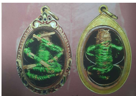
ภาพที่ 4 หุ่นพยนต์รุ่นกลางของอาจารย์ลอย โพธิ์เงิน