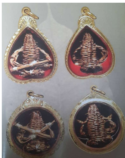
ภาพที่ 3 หุ่นพยนต์รุ่นต้นของอาจารย์ลอย โปธิ์เงิน