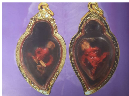
ภาพที่ 5 หุ่นพยนต์รุ่นปลายของอาจารย์ลอย โปธิ์เงิน