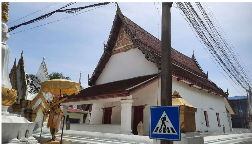
ภาพที่ 2 วัดรัตนชัย พระนครศรีอยุธยา ในปัจจุบัน