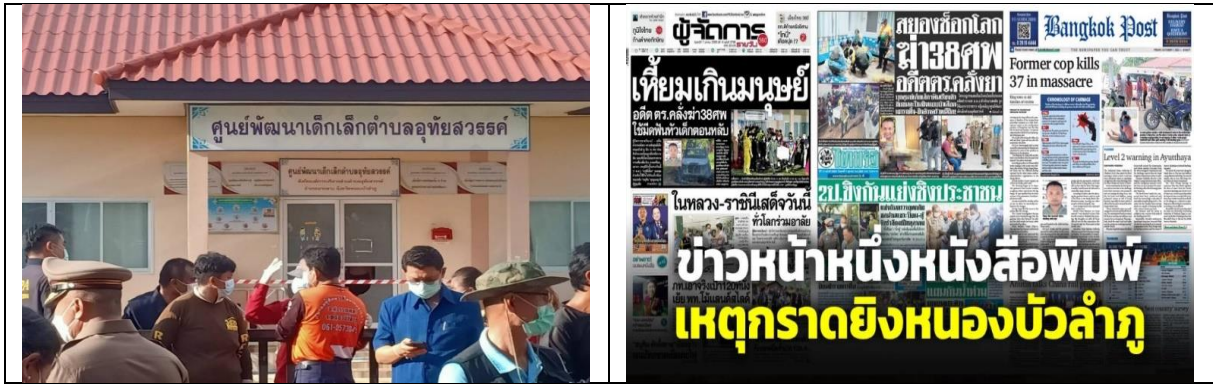
ภาพที่ 1 กรณีที่ 1 : กราดยิงหนองบัวลำภู

(ที่มา : Business Prachachat, 2022; Online manager, 2022)