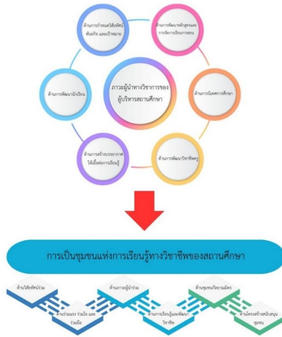
ภาพที่ 1 แสดงความสัมพันธ์ระหว่างภาวะผู้นำทางวิชาการของผู้บริหารกับการเป็นชุมชนแห่งการเรียนรู้ทางวิชาชีพของสถานศึกษา