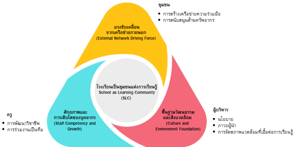
ภาพที่ 2 แนวทางสู่ความสำเร็จของโรงเรียนเป็นชุมชนแห่งการเรียนรู้ (SLC)

แนวทางสู่ความสำเร็จของโรงเรียนเป็นชุมชนแห่งการเรียนรู้ (SLC) ประกอบด้วย 3 องค์ประกอบ ได้แก่ 1) พื้นฐานวัฒนธรรมและสิ่งแวดล้อม 2) ศักยภาพและการเติบโตของบุคลากร และ 3) แรงขับเคลื่อนจากเครือข่ายภายนอก