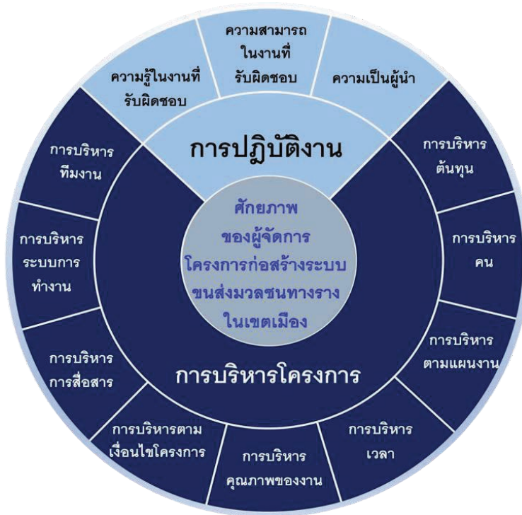
รูปที่ 3 รูปแบบการพัฒนาศักยภาพของผู้จัดการโครงการก่อสร้างระบบขนส่งมวลชนทางรางในเขตเมือง

จากรูปที่ 3 แสดงองค์ประกอบของการพัฒนาศักยภาพผู้จัดการโครงการก่อสร้างระบบขนส่งมวลชนทางรางในเขตเมือง แบ่งออกเป็น 2 องค์ประกอบหลัก 12 องค์ประกอบย่อย ได้แก่ ด้านองค์ประกอบหลักที่ 1 ด้านการปฏิบัติงาน ประกอบด้วย องค์ประกอบย่อยที่ 1) ความรู้ในงานที่รับผิดชอบ 2) ความสามารถในงานที่รับผิดชอบ และ 3) ความเป็นผู้นำ ส่วนด้านองค์ประกอบหลักที่ 2 ด้านการบริหารโครงการ ประกอบด้วยองค์ประกอบย่อยที่ 4) การบริหารทีมงาน 5) การบริหารต้นทุน 6) การบริหารคน 7) การบริหารแผนงาน 8) การบริหารเวลา 9) การบริหารคุณภาพของงาน 10) การบริหารตามเงื่อนไขโครงการ 11) การบริหารงานสื่อสารสัมพันธ์ และ 12) การบริหารระบบการทำงาน