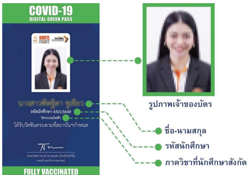
Figure 3 Show an example of an e-Portfolio card for use as evidence of receiving all vaccinations as specified, King Mongkut's Institute of Technology Ladkrabang