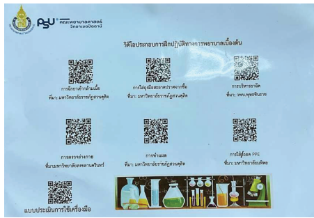
Figure 4 Video card for basic nursing practice