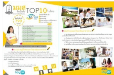
ภาพประกอบ 1 ขั้นตอนการพัฒนาสื่อสิ่งพิมพ์

1. การพัฒนาสื่อสิ่งพิมพ์ ผสานความจริงเสริม ผู้วิจัยได้จัดเตรียมทรัพยากรที่ใช้ในการพัฒนาสื่อสิ่งพิมพ์ ผสานความจริงเสริม และดำเนินการผลิตสื่อตามรูปแบบที่ได้ศึกษา