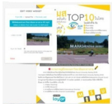
ภาพประกอบ 2 ขั้นตอนการพัฒนาสื่อ ผสานความจริงเสริม