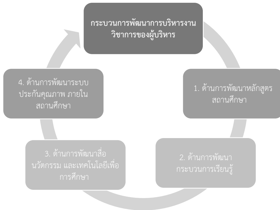
แผนภาพที่ 2 แสดงกระบวนการพัฒนาการบริหารงานวิชาการของผู้บริหารสถานศึกษา

จากการวิจัยทำให้เกิดองค์ความรู้ซึ่งเป็นกระบวนการพัฒนาการบริหารงานวิชาการของผู้บริหารสถานศึกษา ดังนี้