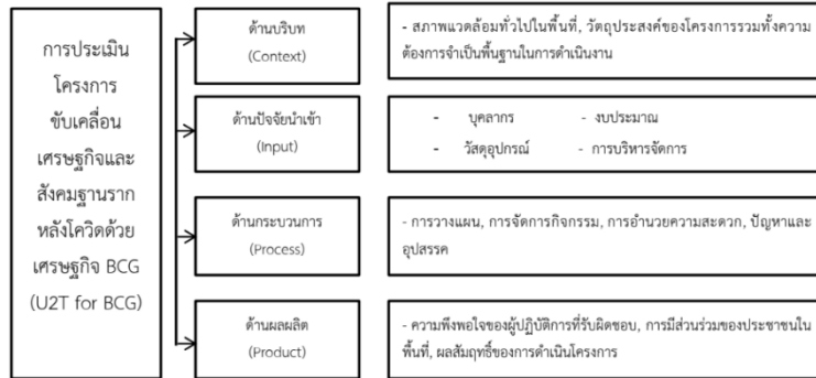
ภาพที่ 1 กรอบการวิจัยในด้าน CIPP Model